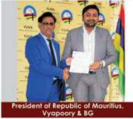
President of Republic of Mauritius, Vyapoory & BG